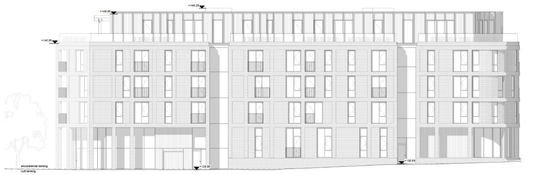
Fasade Nordøst 1:100