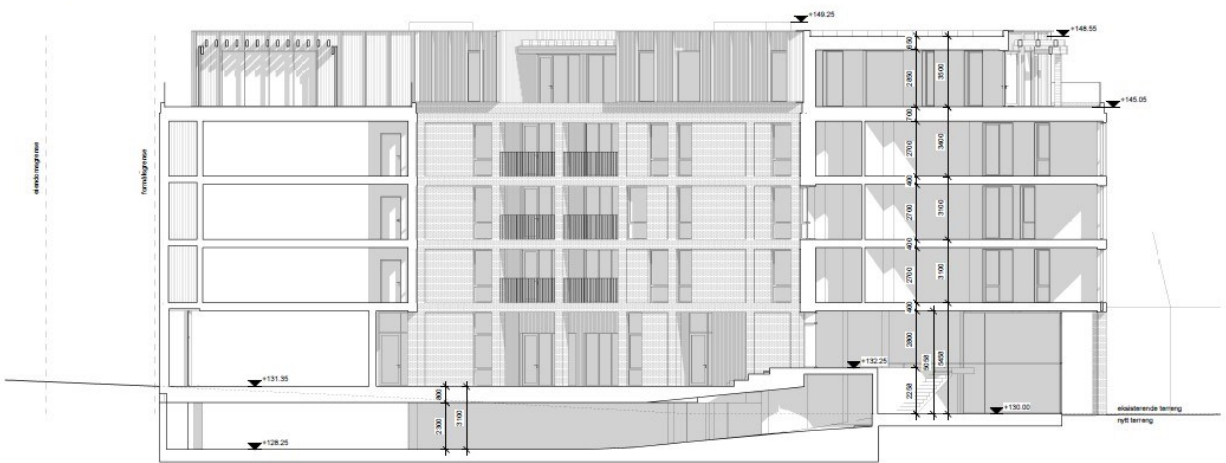
Snitt B-B 1:100