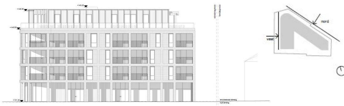
Fasade Vest 1:100