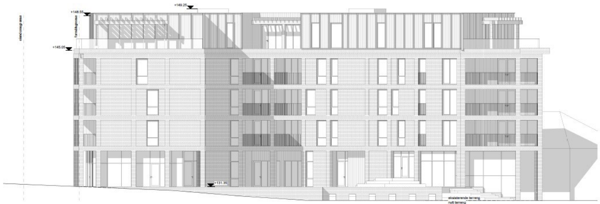
Fasade Ser 1:100